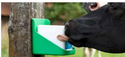
STANDARD | algemeen

Wetenschappelijk onderzoek laat zien dat toevoeging van 70 gram extra zout aan het rantsoen de urineproductie met gemiddeld 23% verhoogt. Dat gebeurt niet met likstenen. Dan neemt de koe namelijk alleen de hoeveelheid zout die nodig is en nooit te veel. Zo hoeft de koe ook niet te compenseren voor extra zout door meer water te drinken.