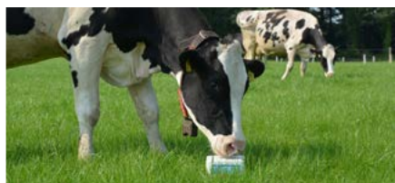
ELEMENTS PLUS | grazend vee